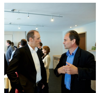
Eindruck vom Austauschtreffen im Januar 2023